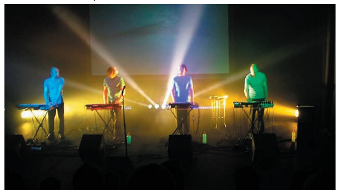
EWHO, live im Kasino am Schwarzenbergplatz, Wien 2005